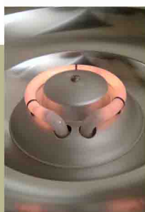
Circline thermo quartz 400 W

Actes de kinésithérapie Centres de soins et thalassothérapie Soulagement des douleurs musculaires et arthrosiques