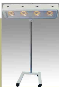
Pied roulant en U