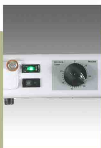
Réglage par minuterie interruptrice