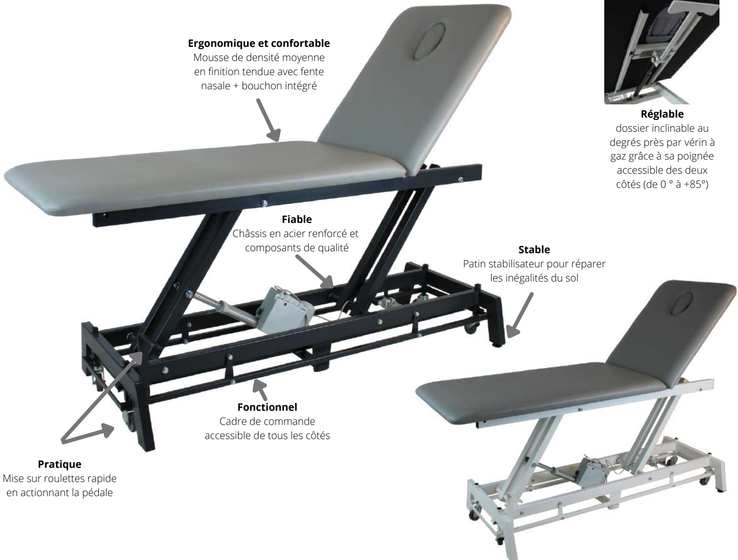
Table 2 plans proclive KIN 10